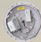
Notstrom-Modul zur Nachrüstung