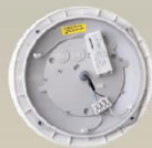
Standard-Modul MultiLumen-Treiber: dreistufig einstellbare Helligkeit (2000lm, 1500lm, 1000lm)

Gezielt Vorbeugen ist besser als ständiges Austauschen: Die LED-Feuchtraum- und Außenleuchten FONDA sind aus extrem robustem Kunststoff gefertigt (Schlagfestigkeitsklasse IK10). Dadurch widerstehen sie versehentlichen Beschädigungen oder bewussten Vandalismus-Angriffen. Typische Anwendungsgebiete sind Außenanlagen, Flure und Treppenhäuser, Sanitärräume sowie Gemeinschaftsunterkünfte. Der HF-Bewegungssensor kann nachgerüstet werden. Die Helligkeit kann auf 2.000 lm, 1.500 lm oder 1.000 lm eingestellt werden. Das schlagfeste Gehäuse ist weiß oder silber und hat optimierte seitliche Kabelzuführungen für die Aufputzinstallation.