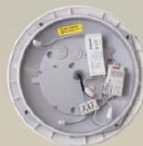
HF-Modul HF-Bewegungssensor zur Nachrüstung